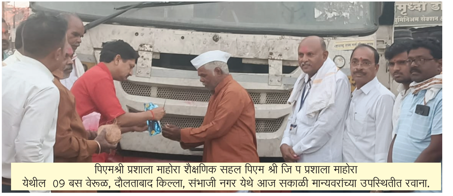
पिएमश्री प्रशाला माहोरा शैक्षणिक सहल पिएम श्री जि प प्रशाला माहोरा येथील ०९ बस वेरूळ, दौलताबाद किल्ला, संभाजी नगर येथे आज सकाळी मान्यवरांच्या उपस्थितीत रवाना.

याच परिसरात एक महिन्यापूर्वी एका दहा वर्षीय मुलाला बिबट्याने हल्ला केल्याने मुलगाही ठार झाला होता. यामुळे वळण व परिसरातील शेतकऱ्यांमध्ये भीतीचे वातावरण निर्माण झाले आहे. शेतामध्ये कापूस वेचणी, ज्वारी सोंगणी, कांदा काढणी हे काम चालू असताना महिलांना संरक्षण म्हणून पुरुषांना त्यांच्या बरोबर शेतामध्ये जावे लागते. ग्रामस्थांची वनविभाग अधिकाऱ्याला वारंवार सूचना देऊनही ते दुर्लक्ष करत आहे. अजून कित्येक मुलांचा जीव गेल्याने प्रशासन झोपेतून जागे होईल असे ग्रामस्थांचे म्हणणे आहे.